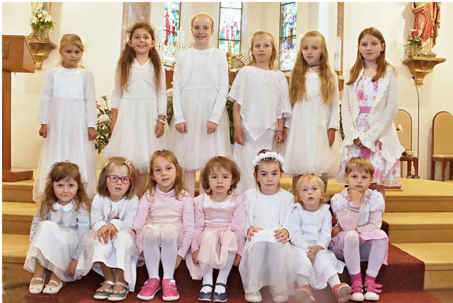
Družičky při letošním průvodu Božího těla v Proseči